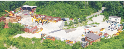
スクラップセンター(神戸市北区)の全景(上)と記念祝樹樹祭(下)